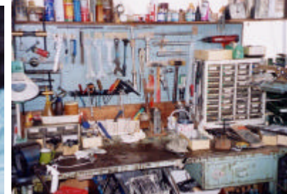
なんて、いい感じなんです