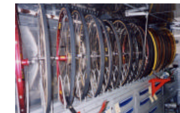
整然と並べられた各種ホイール