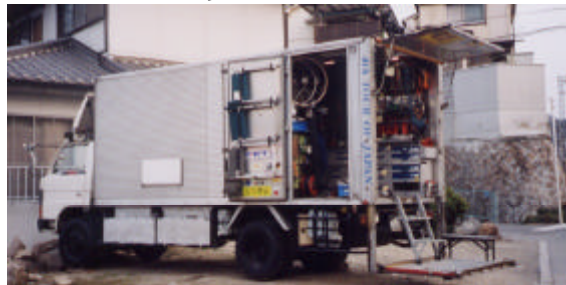
これがうわさのメンテナンスカー