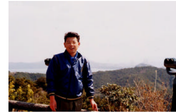
四方見展望台で「ここからはラクチン」

この展望台は、スカイラインの中でも標高が一番高いところで、ウチノ海の絶景が見渡せます。この景色を見ていると、つい