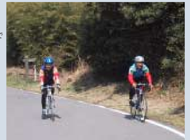
▲ 同じく新車は森会員とインターマックス(左) (大坂峠頂上付近で)