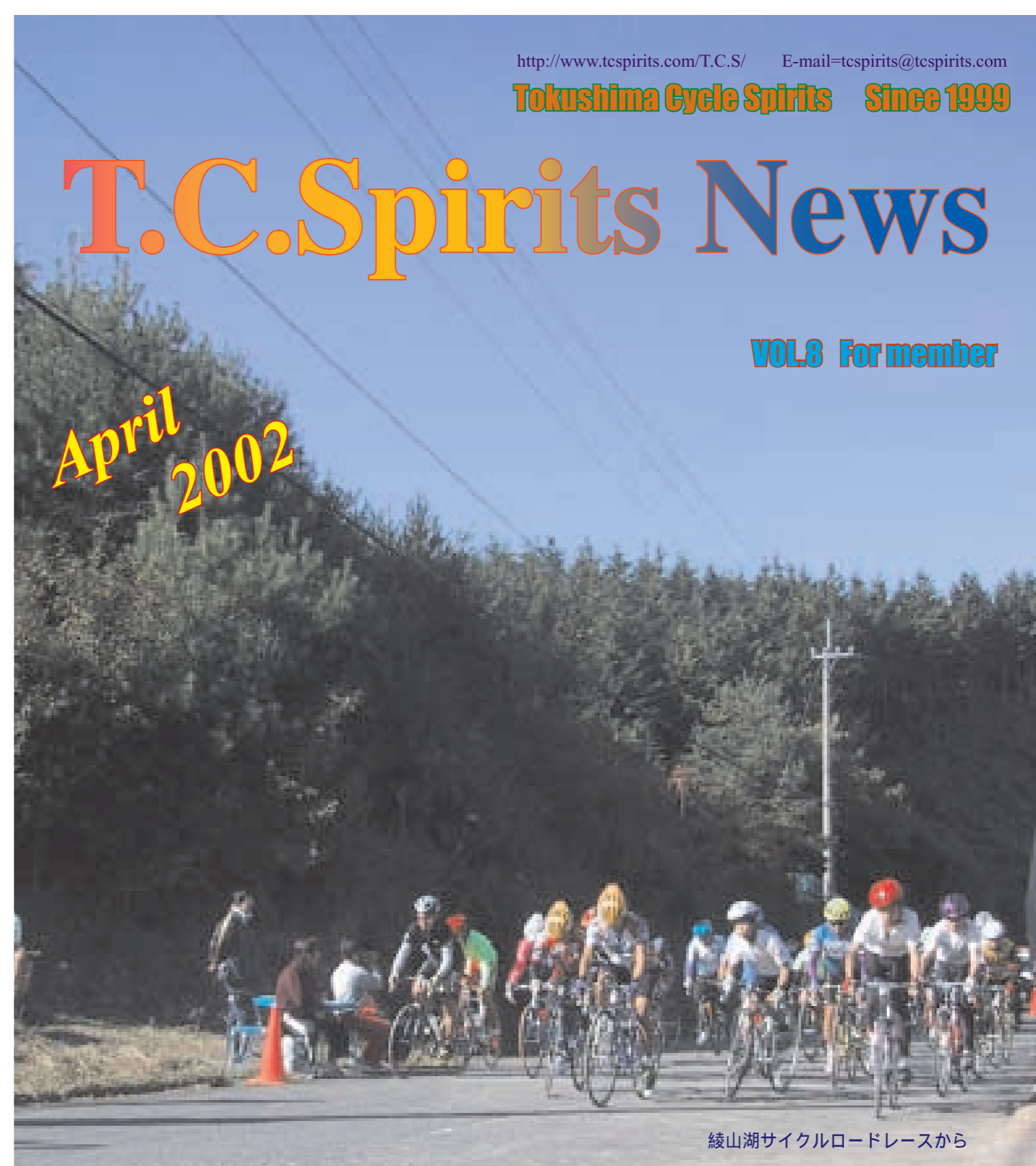
綾山湖サイクルロードレースから

T.C.Spirits 会員のみなさんお待たせしました。不定期発行のT.C.Spirits会報が、久々の発行です。事務局がこのところさぼっていたので、いやはや申し訳ないやら。したがって題材も四国88カ所リレーなど、ちょっと古いものとなってしまいました。内容も写真がかなり多いようでした、まあいいですかね。